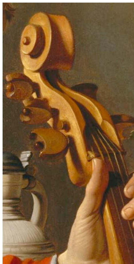
HONTHORST Gerrit le concert 1630 vers Rome, villa Borghèse

Ces deux types d'instruments, le « violoncello » et la « basse de violon » vont évoluer, cohabiter, se mélanger, se confondre quelque fois durant tout le XVIIe et ce jusqu'au début du XVIIIe. Après 1730 - 1740, on peut dire que le « violoncello » assure aussi bien le rôle de continuo que de solo. Il est en quelque sorte l'instrument hybride qui représente le compromis idéal entre la plus grande « basse de violon » et les plus petits « violoncelli » tant du point de vue de ses fonctions, que de sa taille.