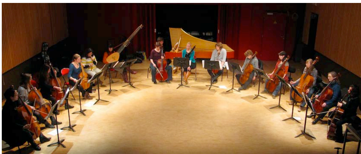
Projet 'Autour des basses' 2013

Ce projet met en lien les classes d'orgue, clavecin, flûte à bec, luth et théorbe, gambe, violoncelle, violone et contrebasse dans le but de présenter des répertoires spécifiques aux instruments graves issus des XVIe, XVIIe et XVIIIe siècles.