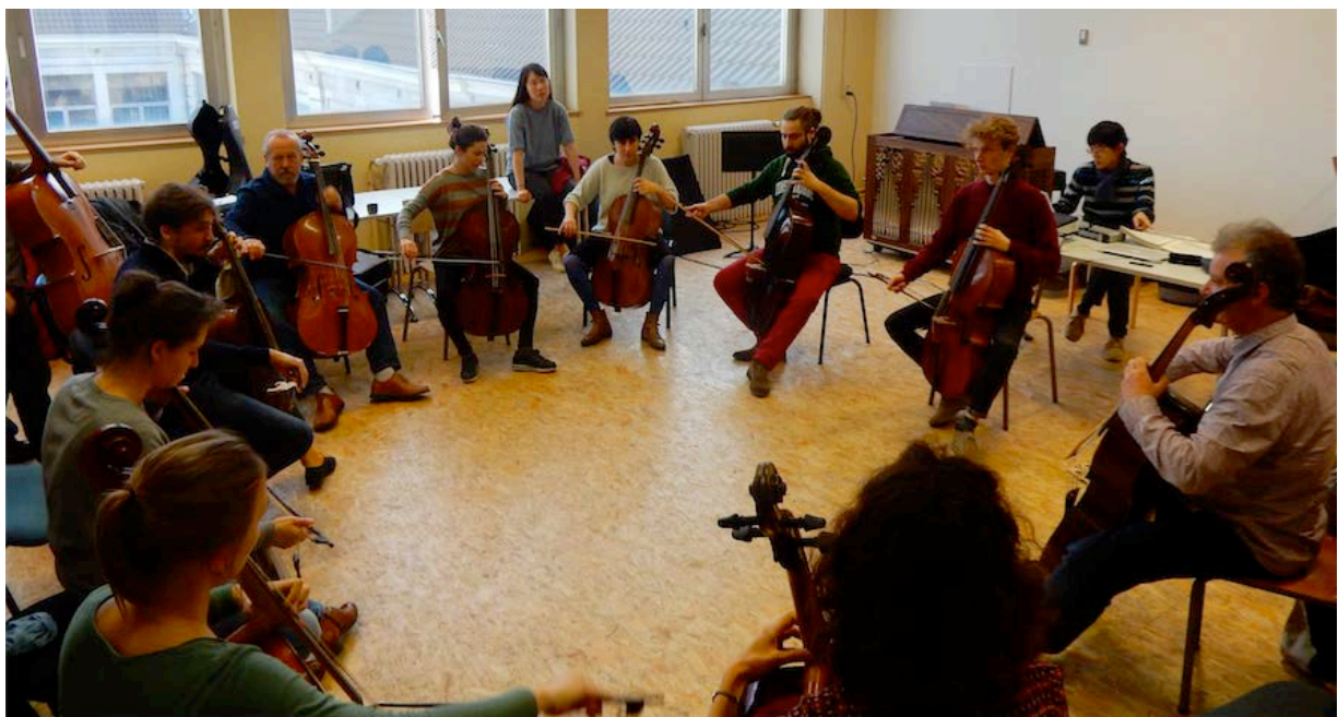
Atelier, Colloque Diminutions 2017

Comme les blocs d'apprentissage, le colloque se clôture par une présentation publique interne à la classe et par un concert public.