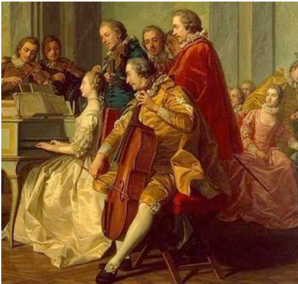
Louis Michel Van Loo, Sextuor (concert espagnol), 1768 Saint-Petersbourg, Musée de L'Hermitage

Le « violoncelle baroque » que nous jouons aujourd'hui est donc plus un instrument classique que baroque.