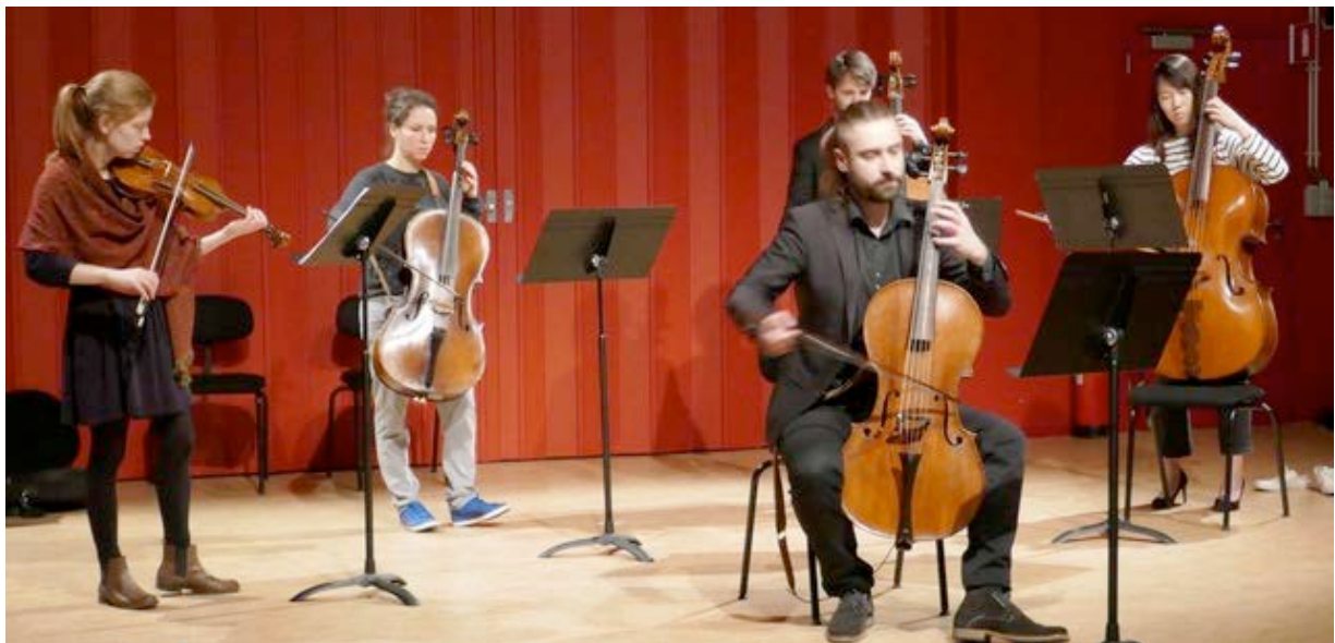
Consort, classe de violoncelle, octobre 2017

Ce cours permet aussi d'inviter d'autres membres de l'équipe pédagogique de la section dans une dynamique transversale. Des invités extérieurs à l'établissement sont aussi régulièrement invités selon leur spécialité, pour aborder des questions précises (lutherie, archèterie, recherche spécifique...)