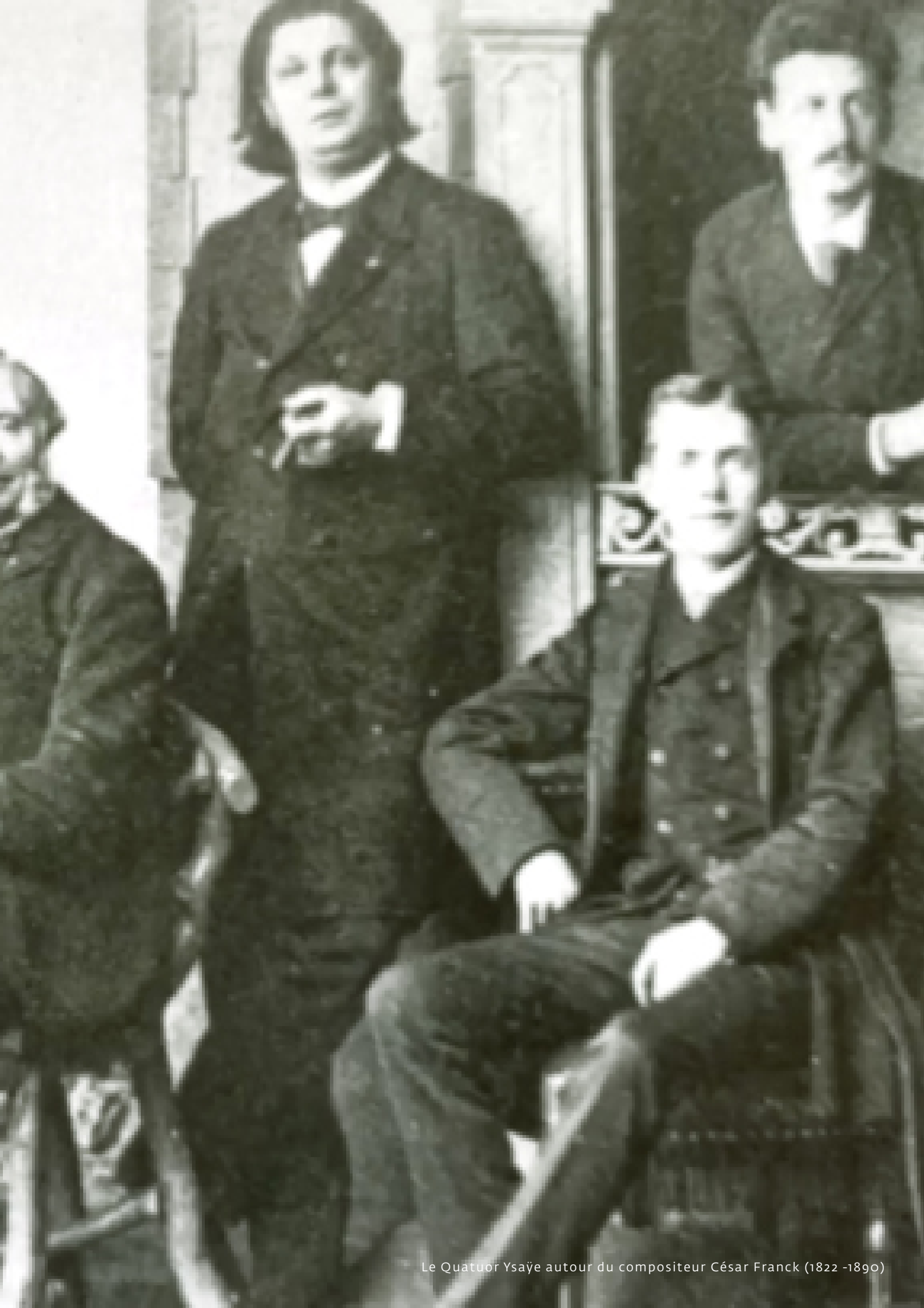
Le Quatuor Ysaÿe autour du compositeur César Franck (1822 -1890)